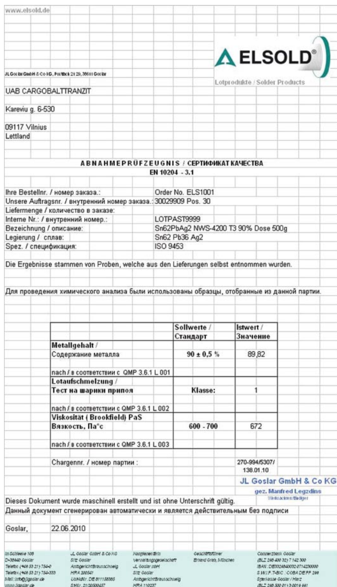
Рис. 2. Сертификат качества, поставляемый с каждой единицей продукции ELSOLD

Суть данного подхода основана на том, что каждый потребитель сам создает для себя паяльную пасту. Каждый специалист может принять участие не только в производственном процессе своего предприятия, но и повлиять на производство технологических материалов для своих задач: