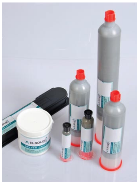
Рис. 5. Разнообразие форм упаковки паяльных паст ELSOLD

– Изменение размера частиц припоя. Стандартный размер частиц