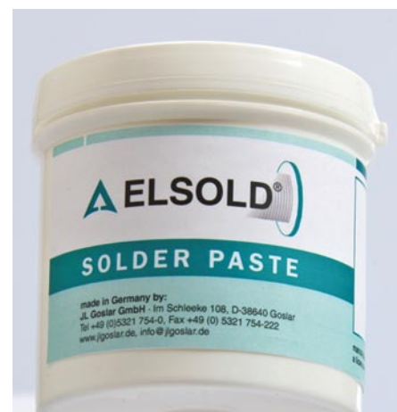
Рис. 3. Паяльная паста AP-10

Для этого компания ELSOLD предлагает ряд стандартных решений, который включает широкий ассортимент флюсов, паяльных паст и припоев. При желании свойства любых материалов можно корректировать, хотя в большинстве случаев материалы со стандартными свойствами удовлетворяют требованиям большинства заказчиков. Для примера, в таблице 1 указаны стандарт-